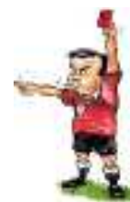
Gent.mo Arbitro C.S.I. Rimini

Oggetto: Riunione gruppo arbitri Giovedì 14/03/2019